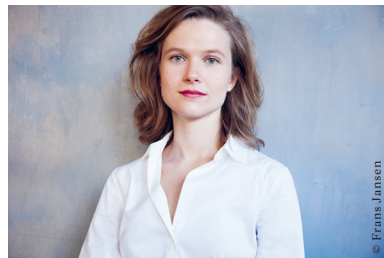
Mirga Gražinytė-Tyla, Leitung